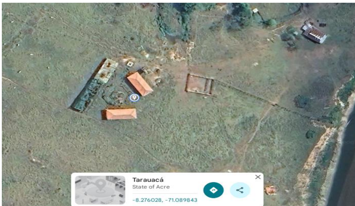
IMAGEM 01: Localização da Escola / Comunidade Pacujá COORDENADAS Latit.: -8.276028 Long.: -71.089843

2.1. A obra será executada na localizada no Alto Rio Tarauacá, Comunidade Pacujá, no Município de Tarauacá/AC.